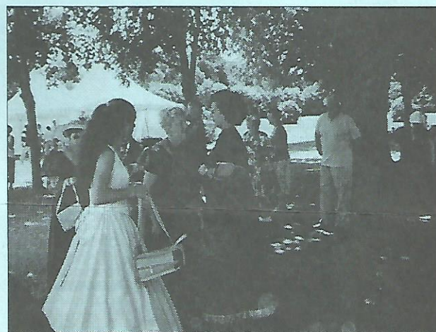
Chaque jour, ce dimanche 29 juin à la Grange, pour la 6 e édition de la grande fête annuelle « Un jour d'été au Château ». Et les belles dames sous les frondaisons comme au temps jadis.