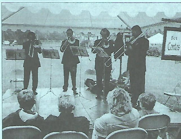
Remarqués, les trombones des Concerts de poche, le 20 avril dans le parc, à l'occasion de la désormais traditionnelle chasse aux œufs de Pâques.