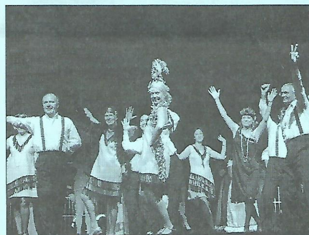
Avec Sénart Danse Passion, l'histoire de la Grange s'est aventurée jusqu'au XX e siècle aux accents endiablés du charleston des années folles.