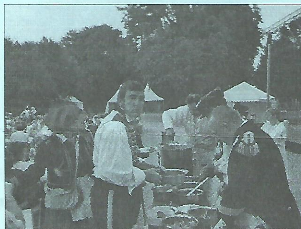
Avant le spectacle, rien de tel qu'une bonne soupe bien chaude, préparée par les Grenadiers d'Ile-de-France, s'il vous plaît !