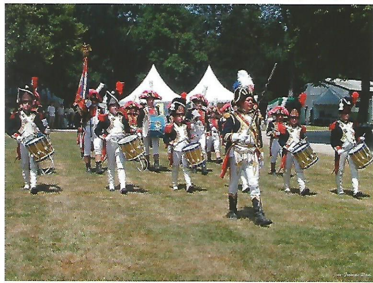
Les grenadiers de Waterloo en ordre de marche