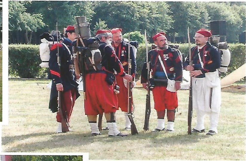
Les zouaves au repos.