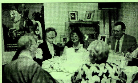
Pour clôturer les manifestations, un dîner impérial apprécié de tous les convives.