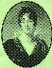
Désirée Clary (1777-1860)

Baptisée au château de la Grange, le 25 novembre 2000, à l'occasion de la célébration du bicentenaire de l'acquisition du domaine, le 4 frimaire An IX, par le général Bernadotte et son épouse Désirée Clary, une rose portera désormais le beau et grand nom de la jeune fille de Marseille, future reine de Suède.