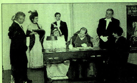
Le général Bernadotte et Desirée Clary signant l'acte d'achat du château, le 24 novembre 1800, 4 frimaire an IX.