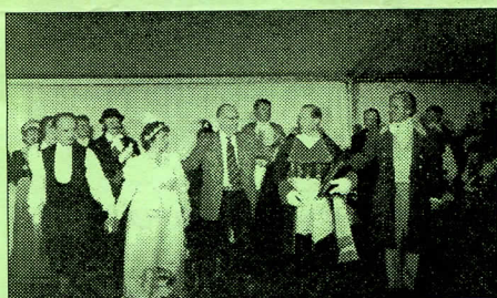
La troupe saluant le public après le tableau final.