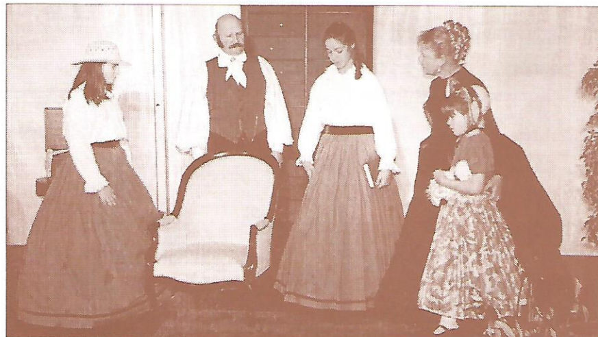
« Si la Grange m'était contée... » – Première – le 25 novembre 2000.

Développer la pièce écrite pour la circonstance du Bicentenaire, en faire un véritable spectacle annuel à la préparation duquel tous les Savigniens intéressés pourraient se consacrer, qui pour jouer, qui pour les costumes, qui pour les décors, etc. : telle est l'ambition affichée.