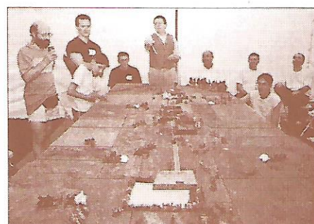
la reconstitution historique avec figurines d'époque : merci à l'association de la Jeune Garde pour cette activité insolite dont les règles ont beaucoup intrigué les visiteurs.