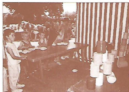
le chamboule-tout de l'ami René a fait recette auprès des jeunes savigniens d'aujourd'hui.