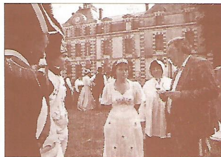
un pont de trois siècles sur notre histoire locale.