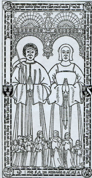
Illustration d'après Guilhermy.

Rien de cette époque ne semble subsister à la Grange de. Mais nous pouvons mieux appréhender le personnage grâce à un important témoignage conservé dans l'église de Saint-Germain-les-Corbeil : sa dalle funéraire ( 2,25 m x 1,11 m).